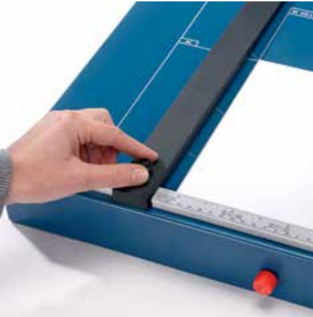
Verstellbarer Metall-Rückanschlag mit Schraubbefestigung zur schnellen Formatfindung - auf beiden Winkelanlagen einsetzbar